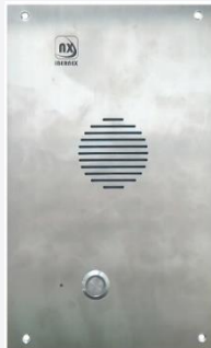
Interfono SIP P2P

La tecnología IP/SIP y la fabricación Nacional, nos permite tener un sistema robusto y las máximas garantías de funcionalidad, así como la versatilidad de desarrollar a medida de las necesidades.